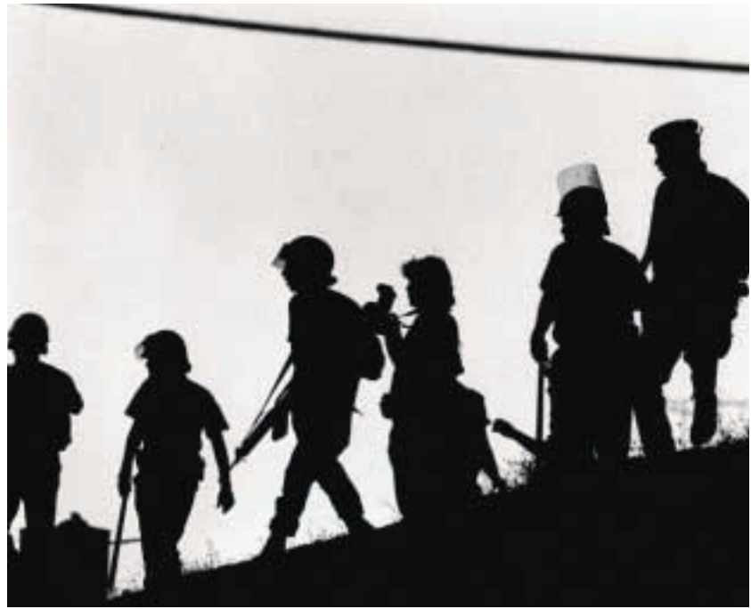
MAG \ magkag khnsh : ototo